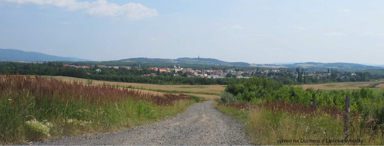
výhled na Duchcov z Liptické vyhlídky