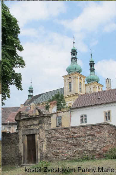
kostel Zvěstování Panny Marie