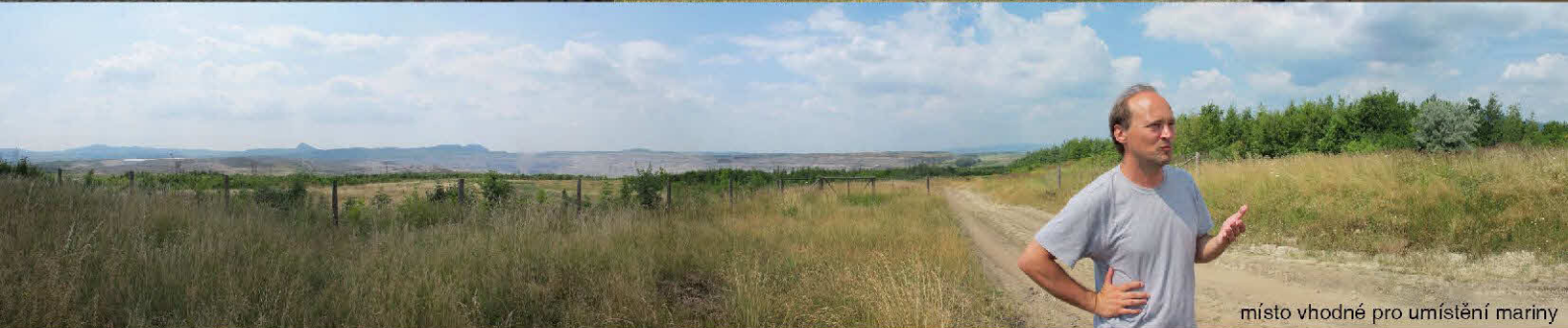
místo vhodné pro umístění mariny